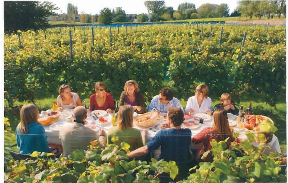
Zomers tafelen in de wijngaard van Gors-Opleeuw.

Hoe haal je het in je hoofd in dit land van weinig zon en veel regen een wijn te willen maken die met witte bourgogne rivaliseren kan? Dat is nochtans de ambitie van Limburger Peter Colemont. En zijn wijnen vallen echt niet naast hun grote voorbeeld uit de toon. _ door bruno vanspauwen